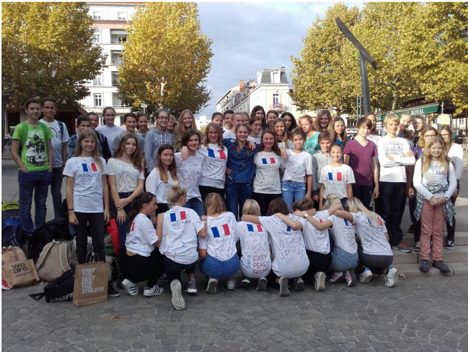
Schüleraustausch Gymnasium Pfarrkirchen – Romans-sur-Isère Okt.